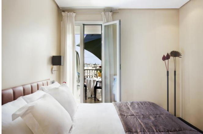
L'hôtel Villa Real à Madrid

En terme gastronomique, l'hôtel Villa Real 5* accueille l'East 47 , un restaurant moderne et cosmopolite qui sert une cuisine méditerranéenne créative, des tapas et de délicieux cocktails.