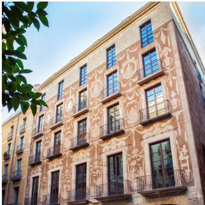
Fachada del Hotel Arai

En definitiva, toda una apuesta por el arte y la cultura que alcanza a todos y cada uno de los establecimientos de Derby Hotels Collection, y a la que en los últimos años se ha unido la gastronomía como complemento ideal para lograr esa experiencia de lujo a la que busca llegar el grupo.