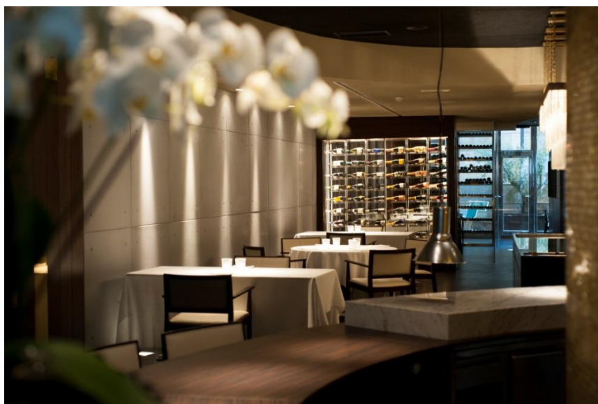
Restaurante Cebo, en el Hotel Urban de Madrid