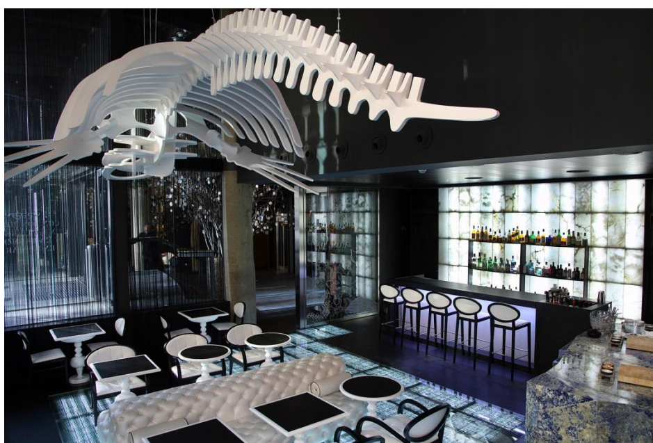
Glass Mar del Hotel Urban