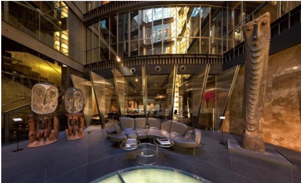
Arte de Papúa Nueva Guinea en la recepción del Urban, en Madrid

de piezas y joyas pertenecientes a culturas de todo el mundo: egipcia, africana, precolombina, romana y budista, entre otras.