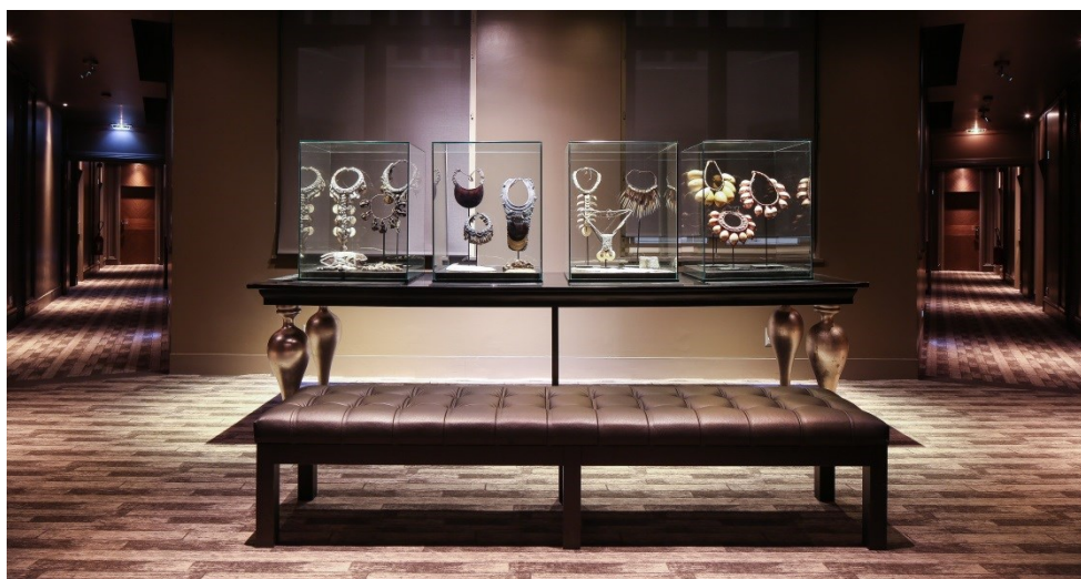
Colecciones de arte en el Hotel Banke, de París