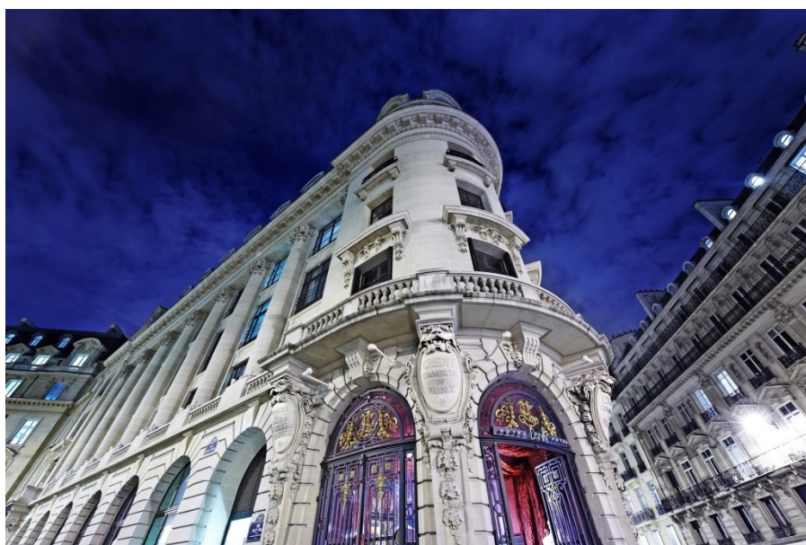
Fachada del Hotel Banke, de París

El edificio, que acogió la sede de un banco a lo largo del pasado siglo, se ha reformado bajo la inspiración neobarroco de la Ópera Garnier