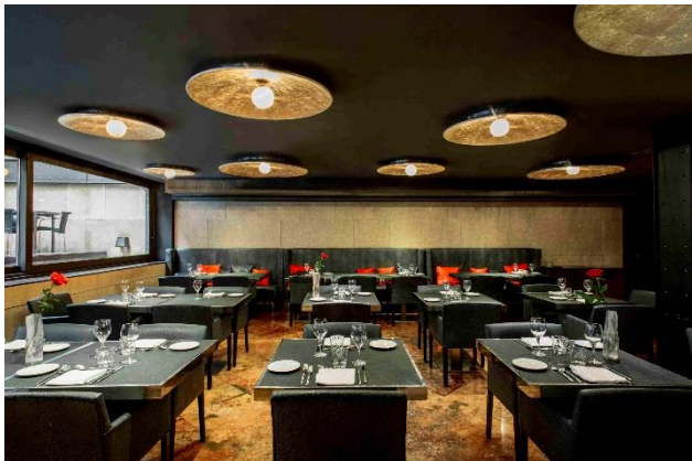
Restaurante hotel Granados 83 de Barcelona

Para una escapada a París, la ciudad del amor, el hotel Banke ofrece un amplio y variado menú degustación. De aperitivo una ostra especial nº3, caviar de limón y ponzu; de entrantes foie gras de canard salteado; gelée de champagne; rábano de daikon a la rosa; y reducción de balsámico a las especias; de pescado vieiras al estilo pot au feu y verduritas en cocción lenta; manzanas poché en bruneoise y sorbete; ternera en cocción lenta; canelones de setas y salsa de trufa; de postres crocante de chocolate blanco y almendras caramelizadas; compota de piña y jengibre confitado; y bizcocho a la almendra; y por último unos dulces como la tartalette de pomelo y vainilla; nubes a la rosa y macaron a la granada.