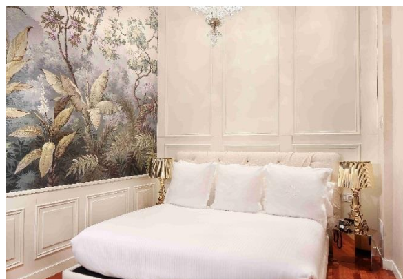
Grand Suite Duplex del Claris Hotel & Spa