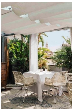
Restaurante La Terraza del Claris de Barcelona

La Terraza del Claris es el único restaurante de la ciudad con formato terraza, abierto durante todo el año. En él, es posible disfrutar en pleno invierno de la alta gastronomía y de las vistas. Su cocina respira Mediterráneo, tradición y técnica con el acento de su cocinero estrella.