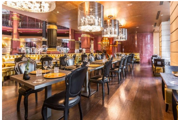
Restaurante Josefin del hotel Banke de París

Y para las parejas que disfrutan viajando juntas, Derby Hotels Collection propone la estancia Stay&Love , con experiencias dedicadas a los más románticos.