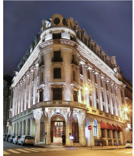
Hotel Banke en París

Derby Hotels Collection también propone la estancia Stay & My Valentine , en el Clarís Hotel & Spa que incluye: