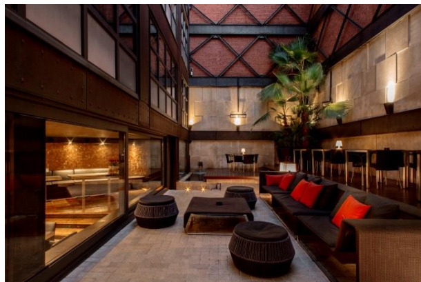
Patio del restaurante "3" del Hotel Granados 83 de Barcelona