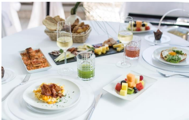
Desayuno para dos en "La Terraza del Claris" de Barcelona

El Hotel & Spa Claris y el Hotel Granados 83 de Barcelona, tienen además el valor añadido de contar, también en San Valentín, con espacios exteriores acondicionados para el invierno. En el Claris es posible disfrutar durante todo el año de la alta gastronomía y de las vistas desde su ya mítica terraza; y en el Granados 83 el invierno ofrece la intimidad y el confort de un típico patio del Eixample.