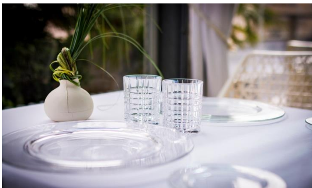
Detalle en mesa de "La Terraza del Claris" de Barcelona

Los tres hoteles presentan un menú degustación basado en ingredientes singulares y en la experiencia de compartir. En el Claris y el Granados 83 de Barcelona, y también en el Banke de París es posible completar la experiencia culinaria con el alojamiento la misma noche de los enamorados. Y para las parejas que deseen planificar, Derby Hotels Collection pone a su disposición los packs Stay&Love, con experiencias dedicadas al placer de viajar en compañía.