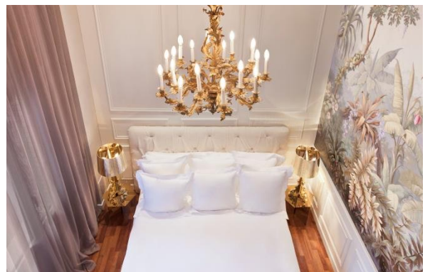
Suite Duplex del Hotel & Spa Claris de Barcelona