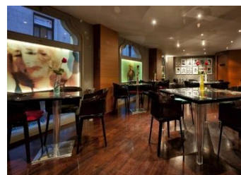
El restaurante East 47, en el Hotel Villa Real, 5*.