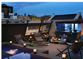
La terraza del Hotel Granados 83, 4*S.