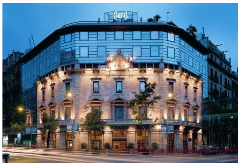
El Hotel Claris, 5*GL, en Barcelona.