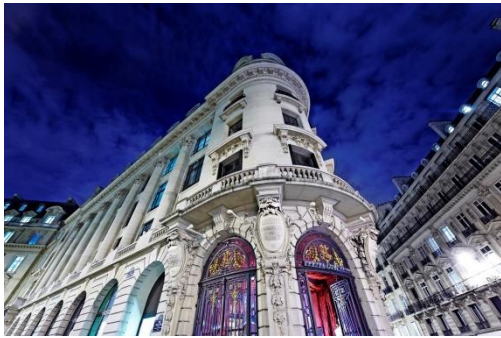
Hotel Banke, 5*, en París.

Los hoteles Banke, en París, y The Caesar, en Londres, ofrecen experiencias para disfrutar de la gastronomía y el ocio en dos de los destinos europeos por excelencia