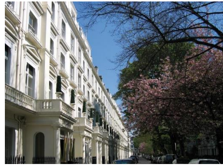
Hotel The Caesar, 4*, en Londres

Londres y París son dos de las ciudades europeas más emblemáticas para una escapada en Semana Santa y los hoteles de Derby Hotels Collection ubicaciones perfectas para disfrutar de estos destinos al máximo. Ubicados en edificios emblemáticos y singulares, todos los hoteles de la colección convierten la estancia en una experiencia única llena de arte y sofisticación.