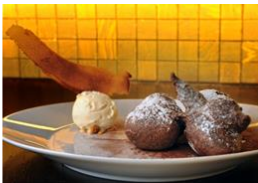
Buñuelos de chocolate, “A la orilla de la chimenea”

El restaurante El Regulador del Hotel Bagués , situado en Las Ramblas de Barcelona, ha elaborado un menú especial para esta festividad. Todos los platos llevan el nombre de algunas conocidas canciones de amor. Por ejemplo, la coca de foie ha sido bautizada con el título “ Se me olvidó que te olvidé ”; el tiradito de vieira con yuzu y ají amarillo, con el tema “ Los dos pensando en lo mismo ”; el salteado de setas con yema, con la canción “ Amores que matan nunca mueren ”; el lenguado a la mantequilla negra, con alcaparras y limón, con el título “ La más bella historia de amor que tuve y tendré ”; y jarrete de cordero a baja temperatura con calabaza y cebolla, con el nombre “ Ahora que nos besamos tan despacio ”.